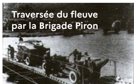
Traversée du fleuve par la Brigade Piron