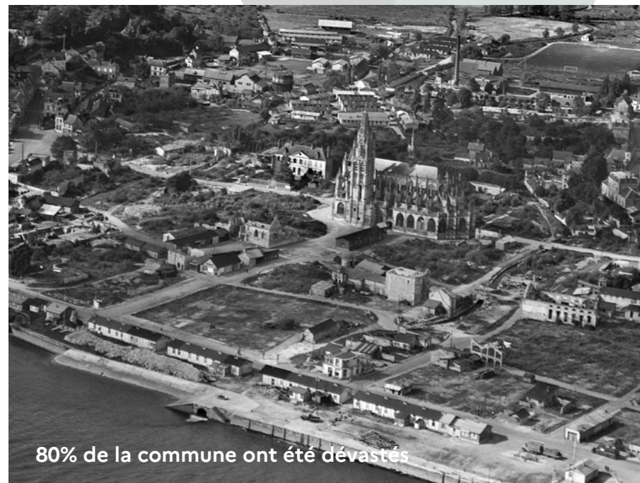
80% de la commune ont été dévastés

4 ans plus tard à La Mailleraye-sur-Seine , entre le 13 et le 27 août 1944, les bombardements alliés tentent de retarder la débâcle allemande et saccagent la ville.